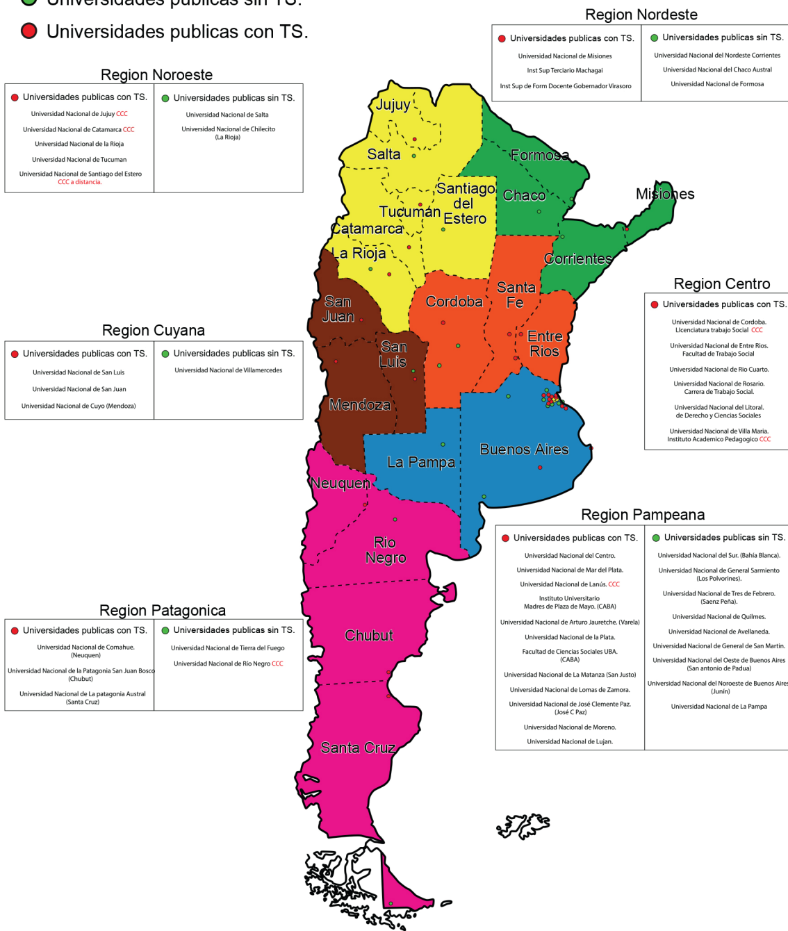
Cuadro 1: FAUATS, elaboración propia, 2017.